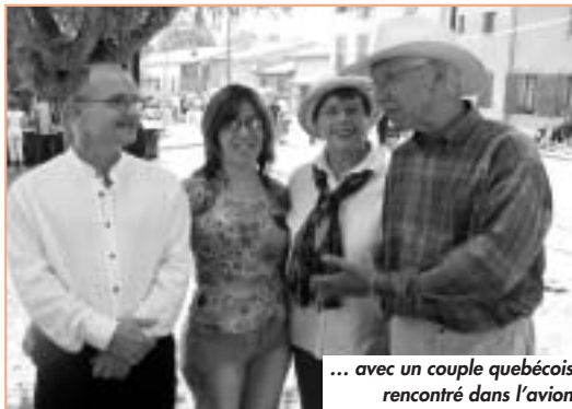
... avec un couple québécois rencontré dans l'avion

Côté animations, en plus du tournoi de foot, la fanfare « Friture Moderne » et le groupe « Triple Croche » ont joué avec dynamisme et célérité des morceaux de choix pour tous les goûts, sans oublier la section Guitare du Foyer Rural qui a