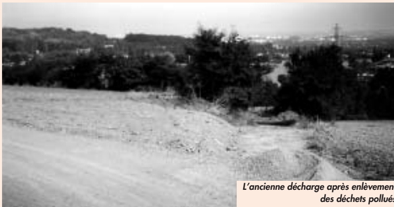
L'ancienne décharge après enlèvement des déchets pollués