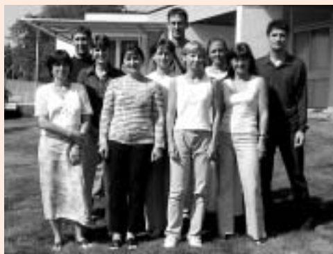
Tableau 1 : École élémentaire 2004/2005

2 numéros par an) et des activités autour d'un thème fort, l'éducation à la citoyenneté . Ce dernier projet recouvre à la fois la sécurité routière et l'EPS (éducation physique et sportive) : il est question de courses de rollers, de pratique du vélo, d'exercices d'orientation, afin d'acquérir la pratique du « déplacement en ville en toute sécurité ». Elle souhaite le concours des animateurs du CLAE pour mener à bien ces actions. Une