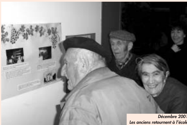
Décembre 2001 Les anciens retournent à l'école

Quand on parle d'inter-génération, on ne considère souvent que les relations entre les petits-enfants et les grands-parents. Mais dès qu'il s'agit d'évoquer les relations parents - enfants dans les jeunes familles, de celles des enfants adultes avec leurs parents âgés, des jeunes travailleurs avec leurs aînés au travail, de celles des jeunes retraités avec les personnes plus âgées, il y a toujours des différences de pensée ou d'action qui trouvent leur origine dans le fait que ces personnes sont de générations différentes. Mais est-ce que l'inter-génération va de soi ? Les personnes âgées ont-elles vraiment le goût de se mêler à de jeunes ados en mal de se distinguer du reste de la société ? Comme je l'ai souvent entendu dire par des personnes âgées, « on est bien content quand nos petits-enfants viennent nous voir, mais parfois on est bien content également lorsqu'ils nous quittent ». À 82 ans, on n'a peut-être plus la capacité de supporter longtemps des jeunes enfants turbulents.