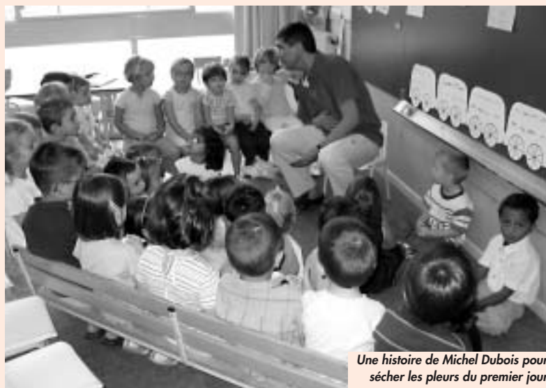
Une histoire de Michel Dubois pour sécher les pleurs du premier jour

convention école-CLAE sera nécessaire pour leur intervention pendant le temps scolaire.