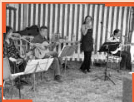
Partie de campagne avec TRIPLE CROCHE