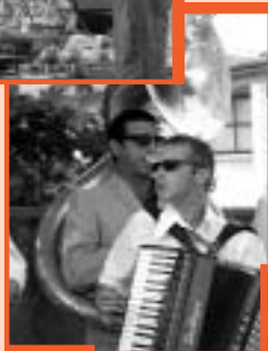
La Friture moderne