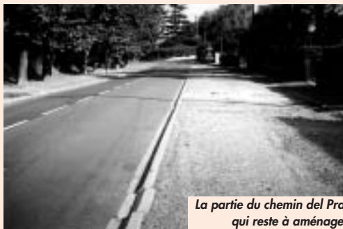
La partie du chemin del Prat qui reste à aménager

du chemin del Prat situé entre, d'une part, le giratoire du square des Droits de l'Homme et de l'allée de la Durante, et, d'autre part, le chemin des Écoles et l'allée du Pré Saint Séverin, est en cours d'étude. Le projet sera arrêté dans le courant du premier trimestre 2005 pour une réalisation des travaux en 2005.