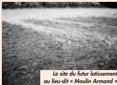
Le site du futur lotissement au lieu-dit « Moulin Armand »

La municipalité a pour projet la réalisation d'un lotissement communal d'une quinzaine de maisons individuelles à construction libre programmé pour 2005.