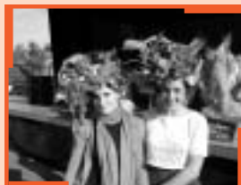
Chapeau Véro !