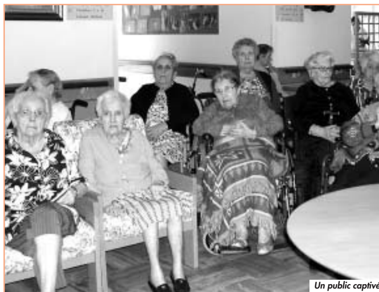
Un public captivé

« Nous avons été sensibles à l' imagerie bleue de nos rêves de terriens, avec le suspense de milliers et milliers de kilomètres entre l'objectif et nos connaissances actuelles. Savez-vous que deux astronautes tiennent à peine dans la capsule qui les emmène sur orbite ? Beaucoup de découvertes