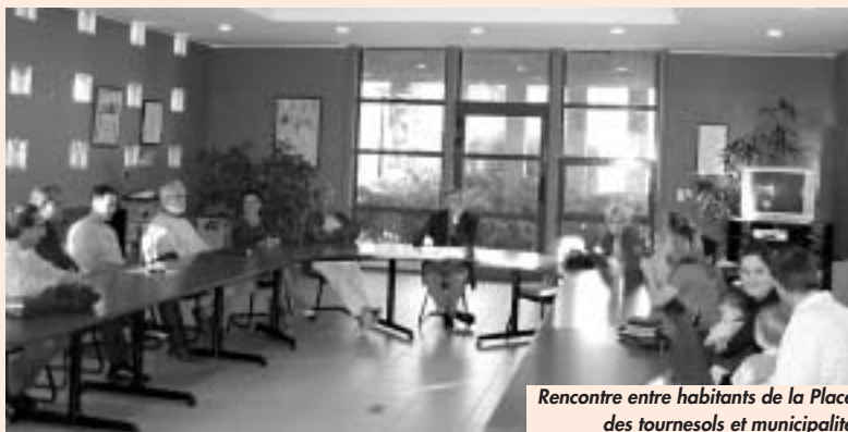
Rencontre entre habitants de la Place des tournesols et municipalité

C'est de la concertation et du dialogue que naissent les idées, que se concrétisent les projets.